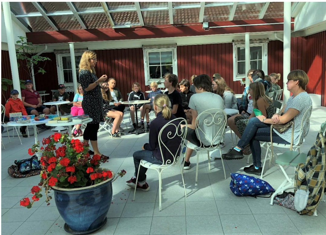
Från Barn- och familjelägret i Röstånga, 2018.